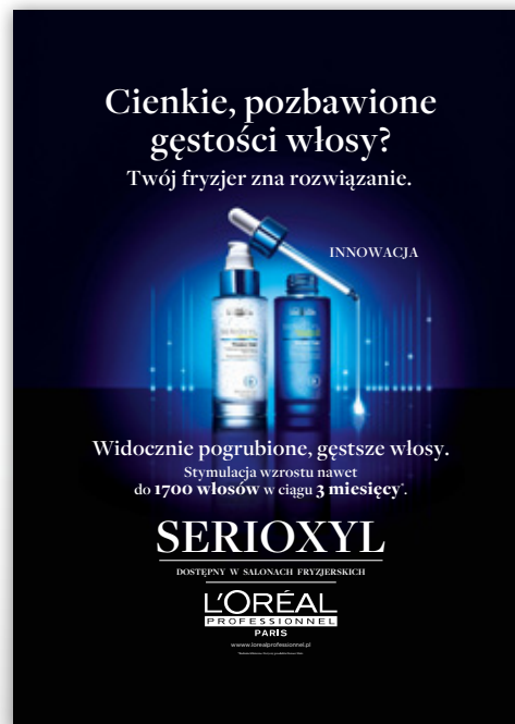
PLAKAT 100 x 140 cm FOLIA ONE WAY VISION