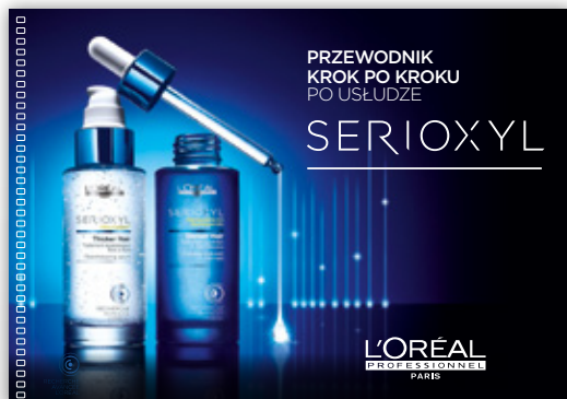
PRZEWODNIK PO USŁUDZE DLA FRYZJERA