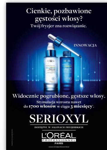
PLAKAT 48 x 68 cm