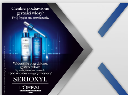
NAKLEJKA NA LUSTRO