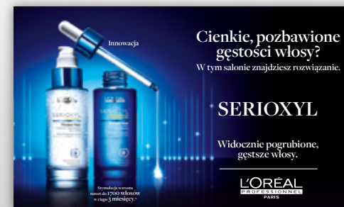
NAKLEJKA NA DRZWI