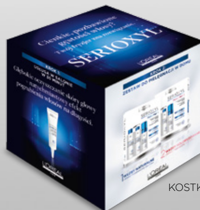
KOSTKA DO WITRYNY